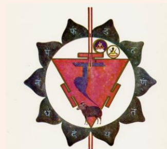
La roue du coeur

Ni le Yoga ni le Shiatsu ni le Counselling ne sont reconnus comme méthodes de soins par l'ordre médical du Luxembourg. Mes séances ne sont pas remboursables par les Caisses de Maladie luxembourgeoise. Mes services ne dispensent pas, le cas échéant, d'un suivi médical.